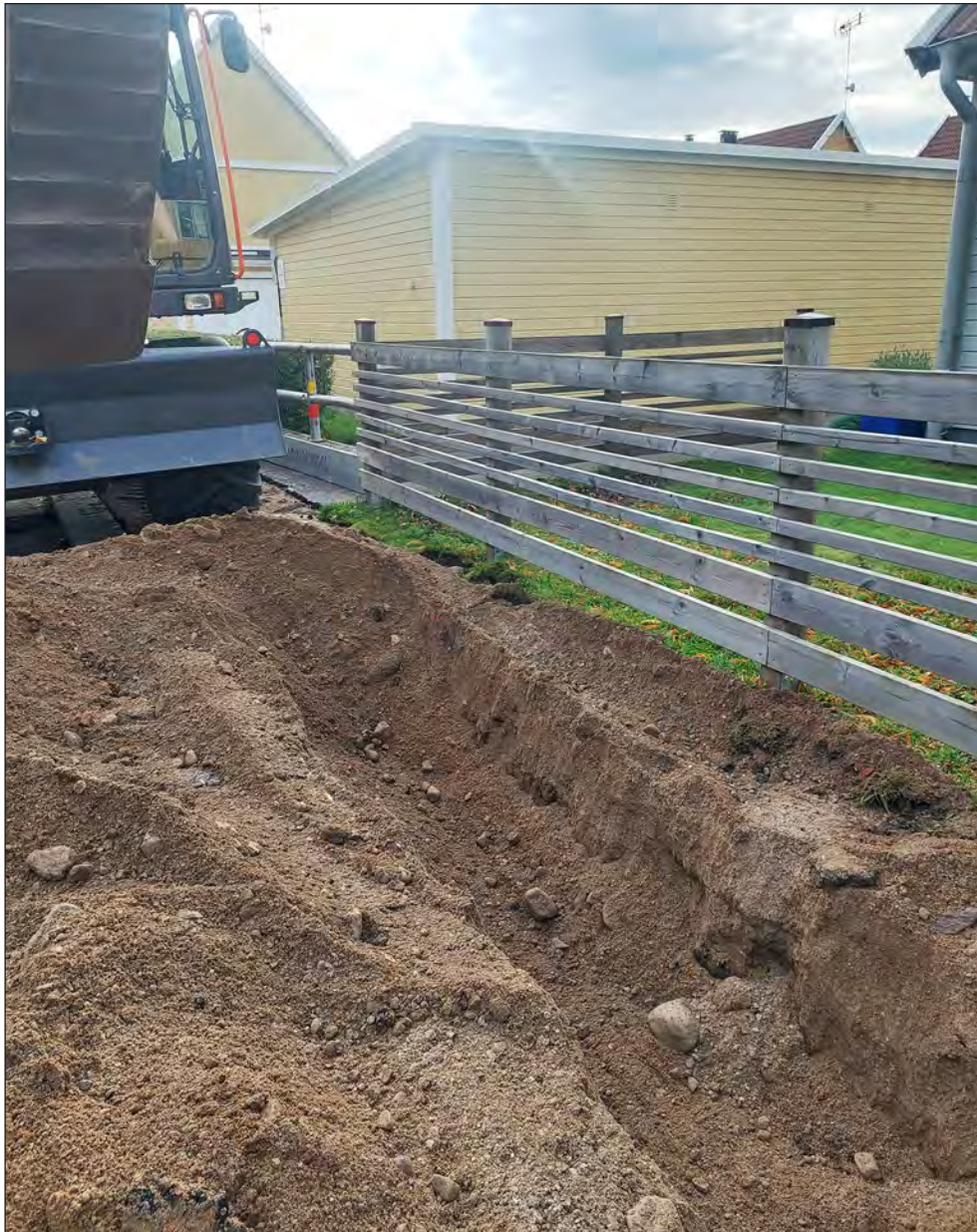
Figur 4. Schaktet längs med Östra hamngatan sett från väster.

Den sammantagna längden på schaktet uppgick till cirka 132 meter med en bredd av cirka 0,7 meter och ett djup av 0,6–0,7 meter. Under asfalt och bärlager vidtog ett fyllnadslager bestående av sand, rullstensmaterial och enstaka moderna tegelfragment. Schaktet grävdes inte igenom fyllnadslagret på något ställe och är därmed inte grävt i botten. Inget av arkeologiskt intresse påträffades i samband med schaktningen.