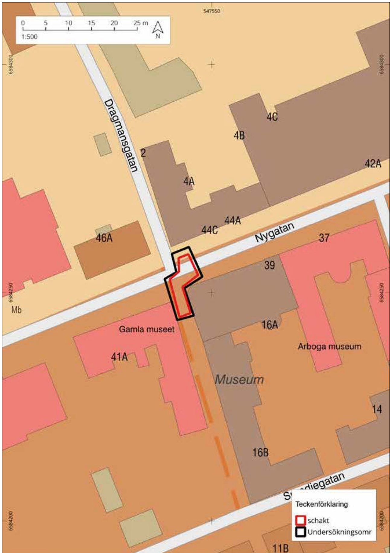
Figur 3. Schaktplan Nygatan-Dragmansgatan. Skala 1:500.